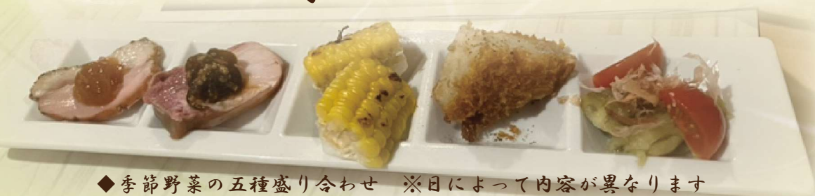
◆季節野菜の五種盛り合わせ ※日によって内容が異なります