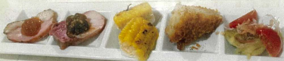
◆季節野菜の五種盛り合わせ ※日によって内容が異なります